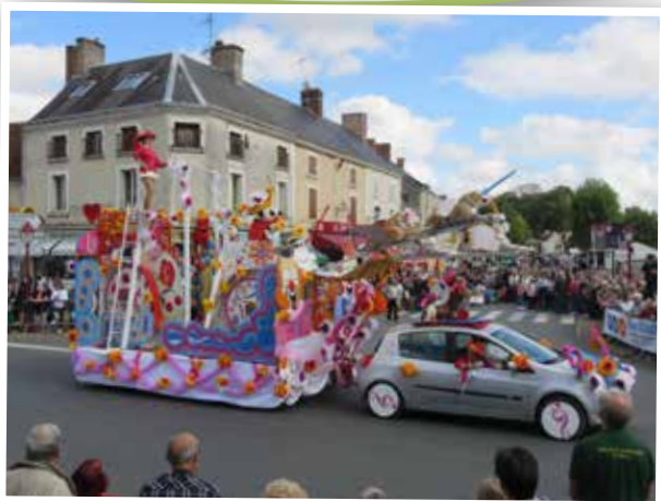
Fête de la Lentille