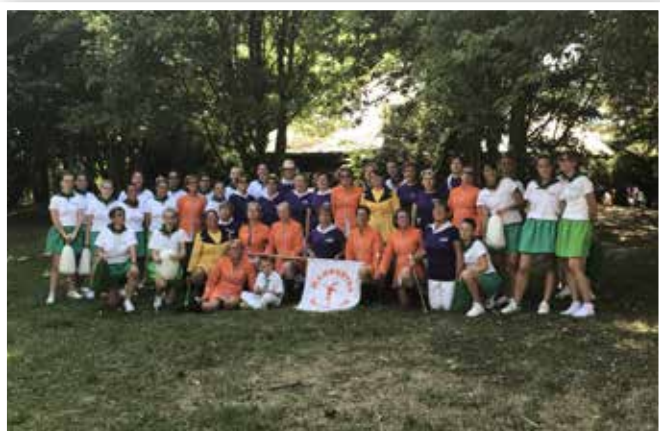
50 ans des Majorettes