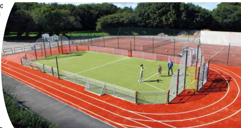
Exemple de City Stade