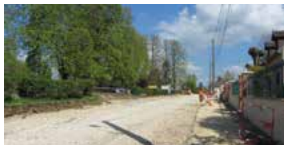
Rue de la Carrière