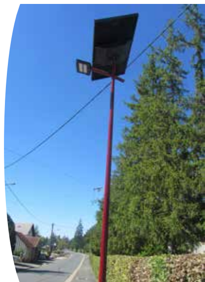
Lampadaire LED rue Ferdinand de Lesseps

De plus, les LED ne contiennent pas de mercure ni de gaz polluant (contrairement aux ampoules classiques) et ce sont des produits recyclables.