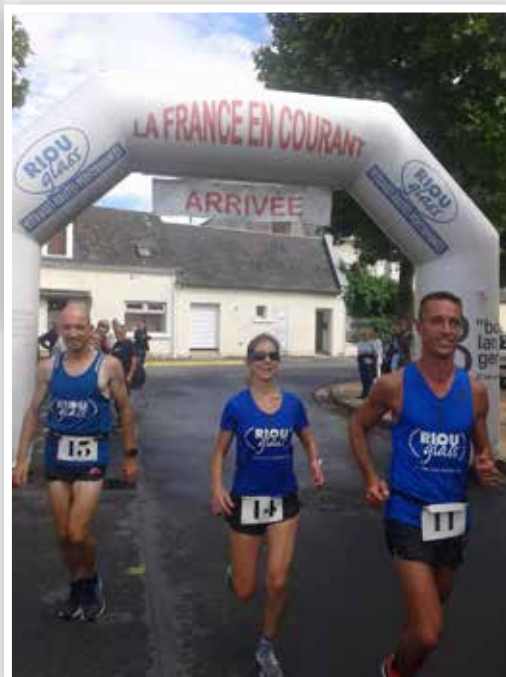
Tour de France en courant