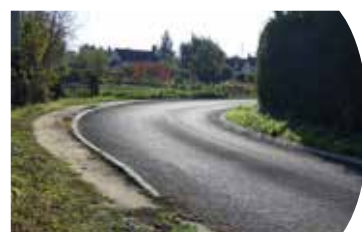
Chemin de Villelune