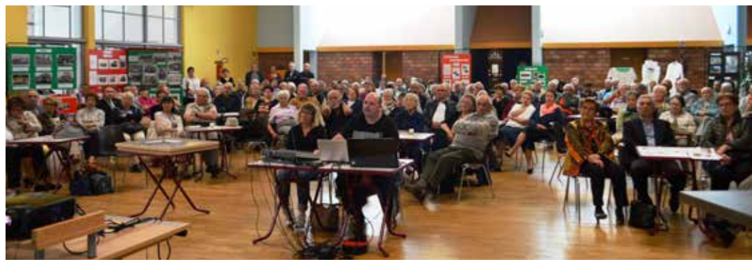
20 ans RGA