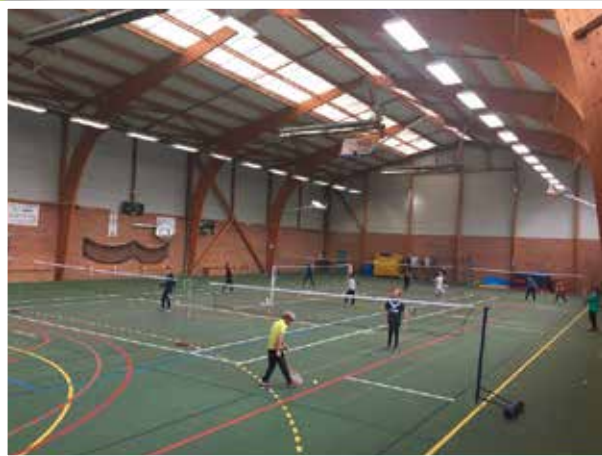
Activités municipales multisports