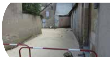
Rue du Puits Parents