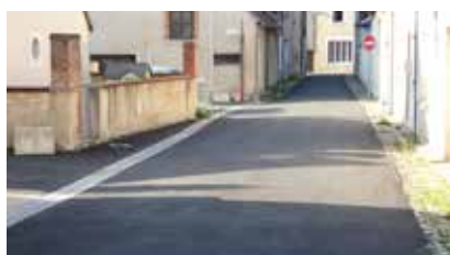
Rue de la Grange des Dimes