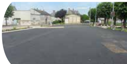
Place de la Liberté